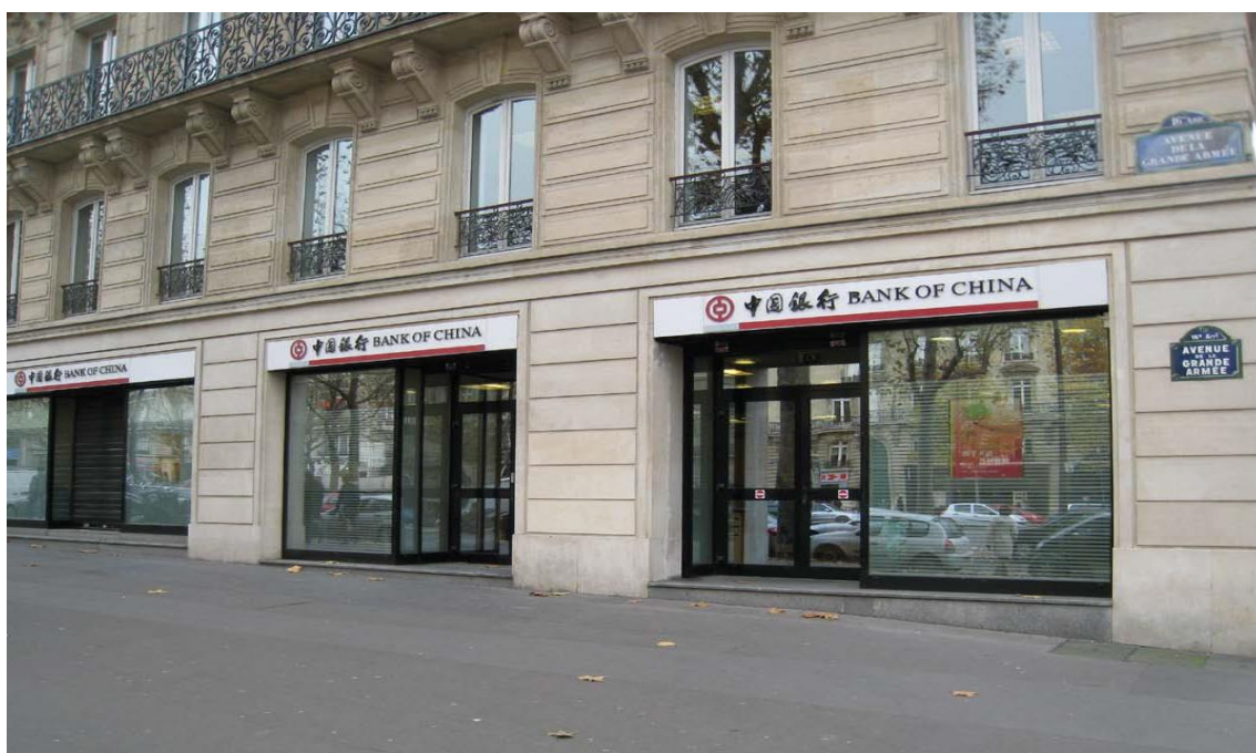
中国银行巴黎分行

【外资银行】主要外资银行有：汇丰银行（HSBC）、巴克莱银行（Barclays）、德意志银行（Deutsche Bank）、苏格兰皇家银行（RBS）、瑞银集团（UBS）。